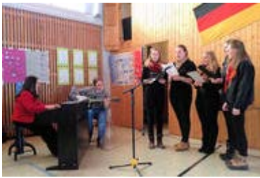
„Édith Piaf“ interpretiert vom Mädchenchor des St.-Ursula-Gymnasiums

Währungsschwankungen, was gerade auch für das Exportland Deutschland von Vorteil ist.